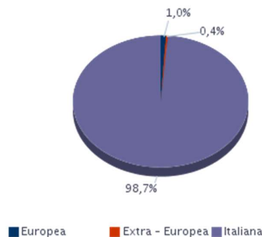
AREA DI PROVENIENZA Campania - 2022