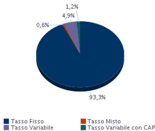
TIPOLOGIA TASSO Lombardia - 2021