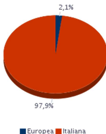
AREA DI PROVENIENZA Sardegna - 2021