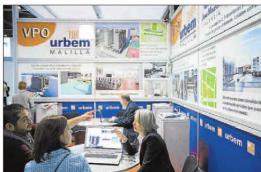
Comercializan de las promociones de Urbem en València.