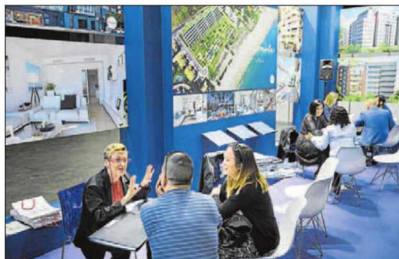
Expositor de Olivares, que promociona el proyecto Amare.