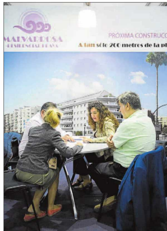
Stand de Malvarrosa Residencial Playa. GERMÁN CABALLERO

La promotora Libra, una de las gestoras de cooperativas más im-