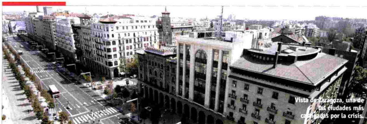
Vista de Zaragoza, una de las ciudades más castigadas por la crisis.