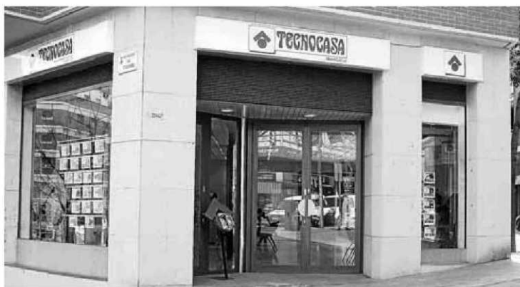
Tecnocasa ha mantenido las agencias situadas en las ciudades de mayor población.

La filial española, con sede en El Prat, pasó de 1.500 oficinas a las 308 actuales