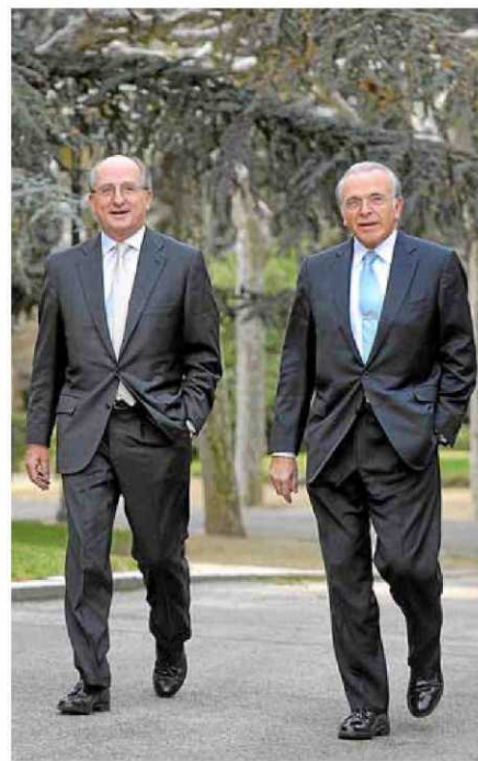
Antonio Brufau, presidente de Repsol, junto a Isidro Fainé, presidente de La Caixa, se dirigen a una reunión con empresarios, en 2010.

hasta mediados de julio para que retome las negociaciones y obtenga algún resultado. Los tres accionistas -y especialmente Pemex, que tiene interés en hacer negocios con Argentina- prefieren un acuerdo en lugar de la incierta batalla legal que se ha planteado hasta ahora. P3