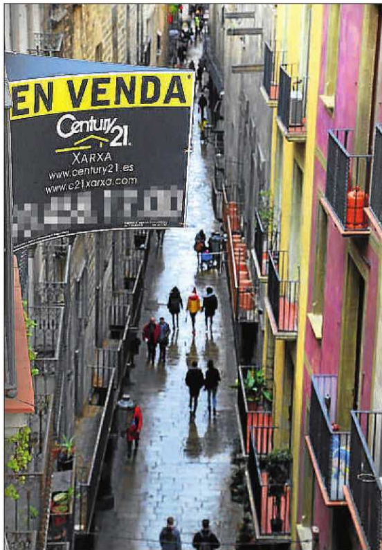
Un piso en venta en la zona de Ciutat Vella, en Barcelona

Pisos de dos habitaciones, en barrios populares y sin ascensor llegan a rentar un 7%